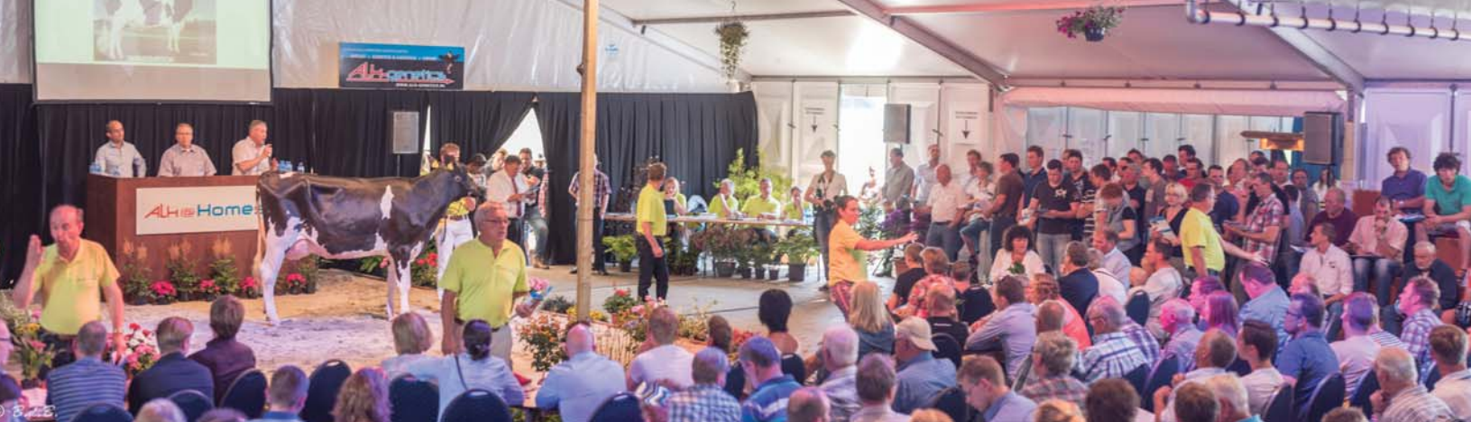
Overview at ALH@Home sale 2013, always attracting a great crowd the ALH sales are a great feature of the European sales calendar

The last 6 Tulip sales which are held at the Holland Holstein Show in December, have seen 346 females average just under EUR7000, and grossed over 2.4 million Euros.