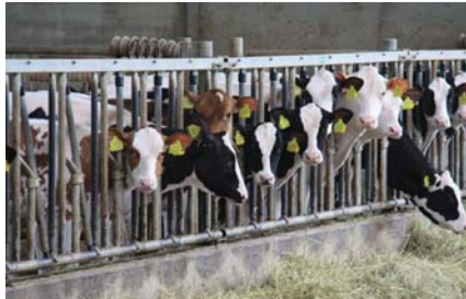
Some of the young heifers at ALH Genetics

vend et les expose partout aux Pays-Bas. Il est aussi un passionné du jardinage et de la pêche. Il aime aussi la vitesse, ceux qui ont été ses passagers le savent très bien!