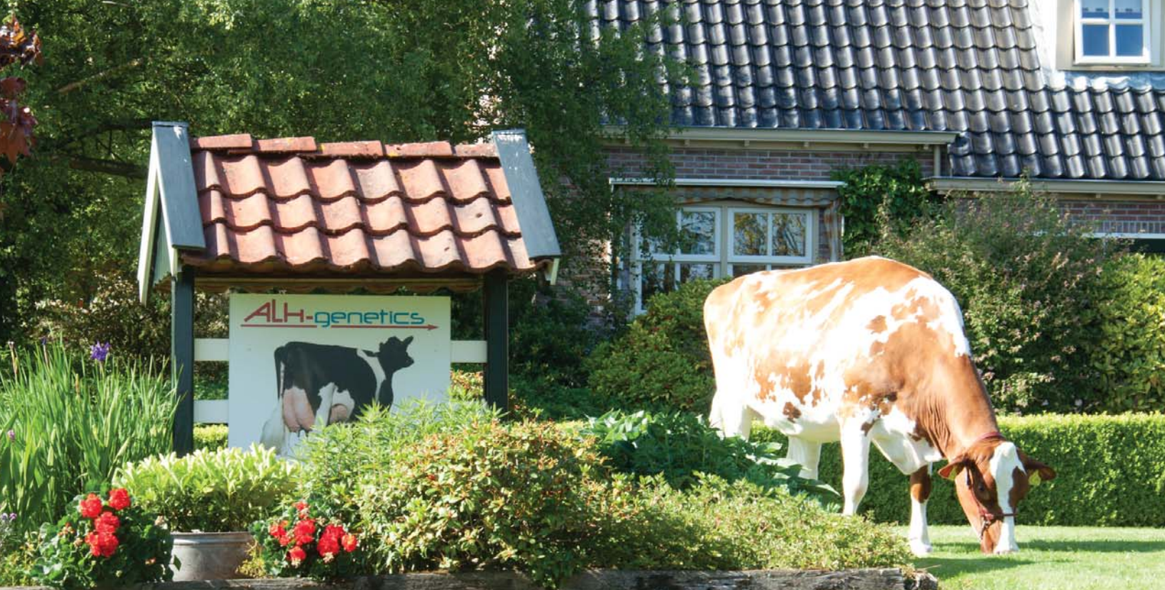
Verhages Bos Candlelight Red VG-86 –The World's former #1 RED GTPI cow, dam of APOLL P RED (RZG 161)- Germany's #1 Red RZG bull and Schreur AltaCasual P RC (+2494)-#6 GTPI Red or RC bull in the world