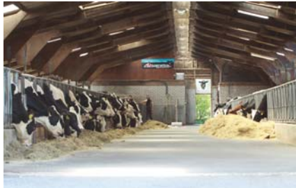
Around 400 jumping bulls are sold per year and a number of females are on permanent flush