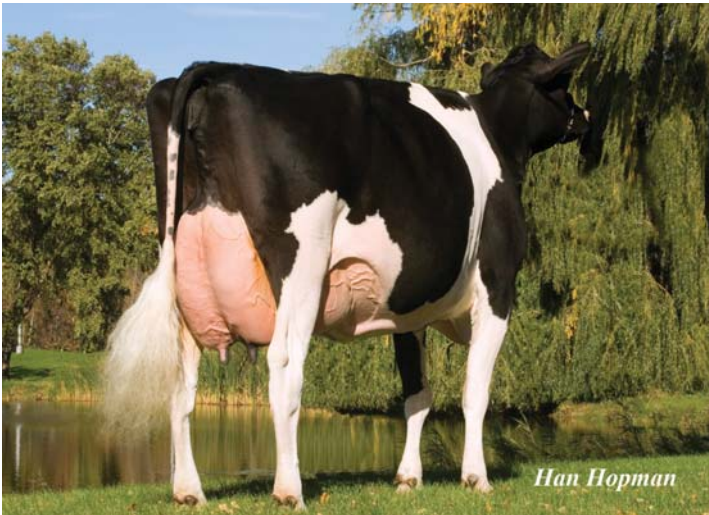
Markwell Durham Daisy Expo 2006; Han-Markwell Durham Daisy EX-92 GMD DOM, delivered exceptional results for ALH. In the last decade she has featured in many proven sires pedigrees including Duke, Dakota, Osaka, Goldday, Danillo and Bakombre

ALH own cattle in the Netherlands and over 20 embryo donors in the United States. Over the years they have invested in key individuals. In the early years, Delta Eugenie VG-88, a maternal sister to Delta LAVA and Delta NOVALIS was purchased by ALH and his former partner Meppelink for €45,455. A granddaughter of Walkup Bell Lou Etta, Eugenie was the foundation for international sires like MASCOL and STYLIST in Germany, RESTELL in France, EMIR in Spain and SPOOKY in the UK and grossed the equivalent of more than EUR150,000 in heifer sales some 20 years ago.