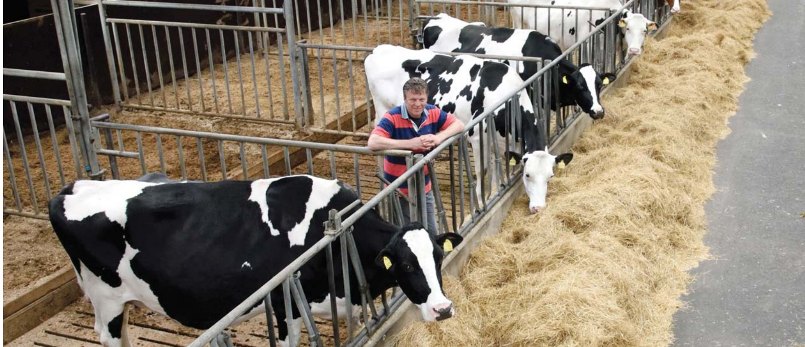
Some of the flush cows housed at ALH genetics

Holstein bloodlines and to do embryo transfer. In 1993 Adolf purchased the farm with 5 hectares of land. Home to ALH Genetics, the premises have grown to 40 hectares with facilities to house around 250 head.