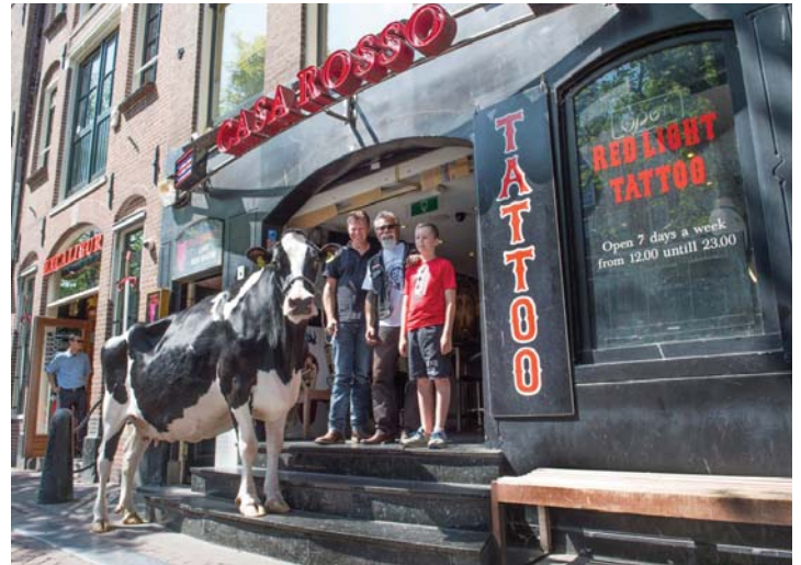
Pictured in the city of Amsterdam, Durham Adina EX, a daughter of MS Kingstead Chief Adeen EX-94 with Adolf and the Hells Angel President of Amsterdam

Successful sales are of course ones where the milk prices are the highest, and they are just one day of the year. Adolf's priority is to create a good atmosphere, and leave people with a good feeling about ALH. "The sale average is much more important than only two or three high sellers to the same syndicate of people," says Adolf.