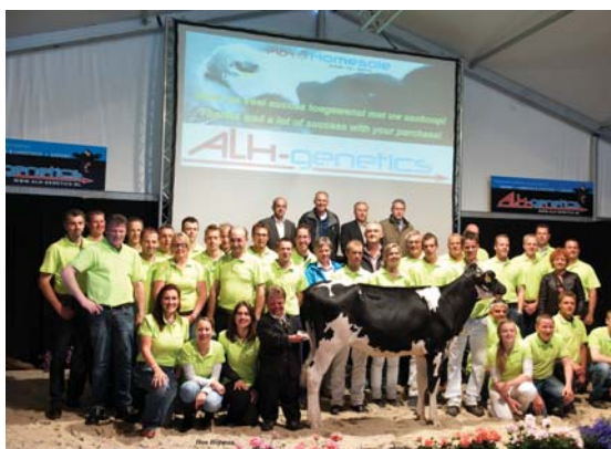
Celebrating 25 years in the business, the first ALH@Home sale was held in 2013