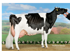
Stammkuh: Batkes Outside Kora EX 94