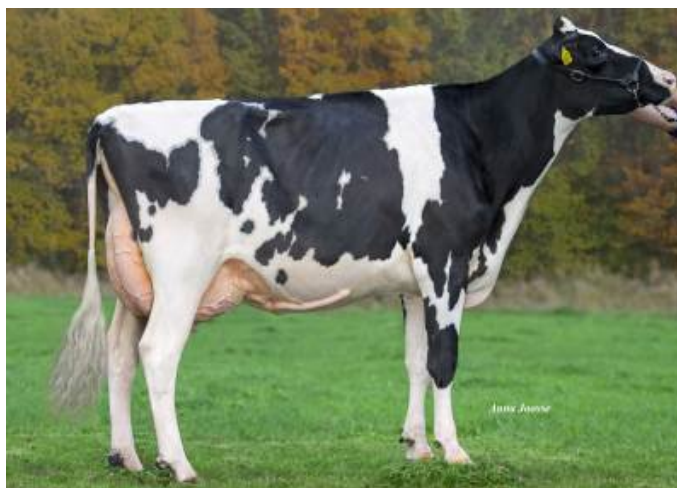
Moeder: Drouner K&L Aiko 1557 VG-89