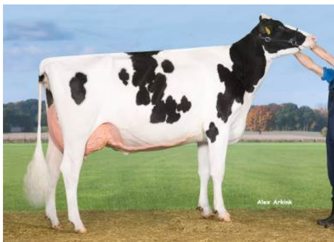
MM: DROUNER K&L AIKO 1398 VG-89